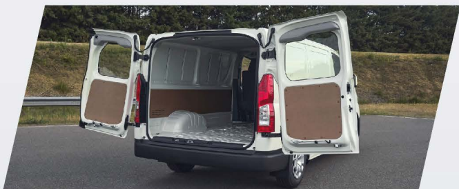
Portón trasero de doble hoja, vidriado, con apertura 90°/180°

Bienvenido al mundo del confort en el espacio de trabajo eficiente. Bienvenido a Toyota Hiace.