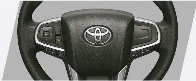
Volante multifunción con control de audio y de teléfono