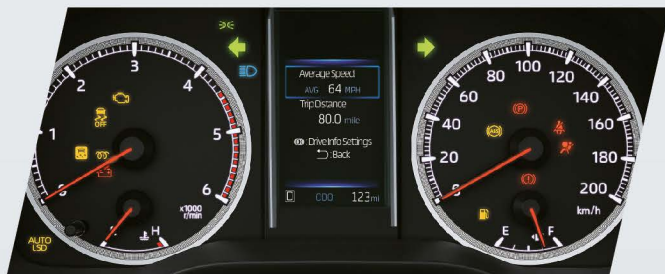
Display de información múltiple con pantalla de color de 4,2" (TFT)