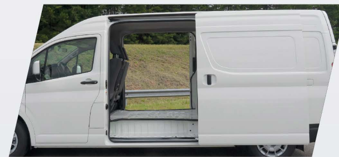
Doble puerta de acceso lateral*