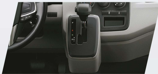
Caja automática de 6 velocidades