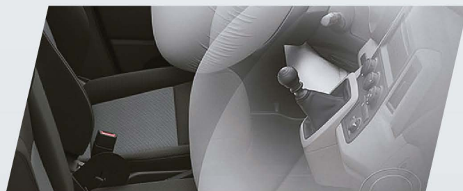
Airbag frontales (x2) con protección para 3 ocupantes