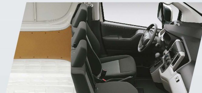
Apoya cabezas delanteros (x3)