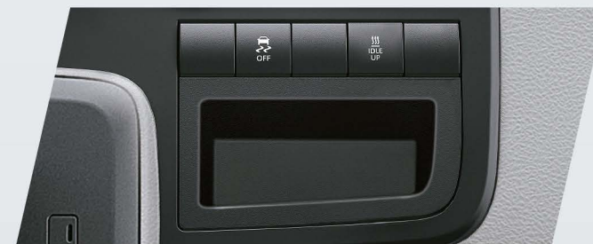
Control de estabilidad (VSC) y Control de tracción (TRC)