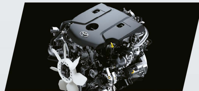
Motor 1GD de 177CV