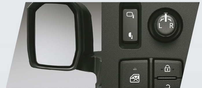
Espejos exteriores con ajuste y plegado eléctrico