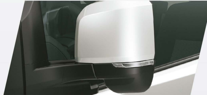
Espejos exteriores de giro angular*