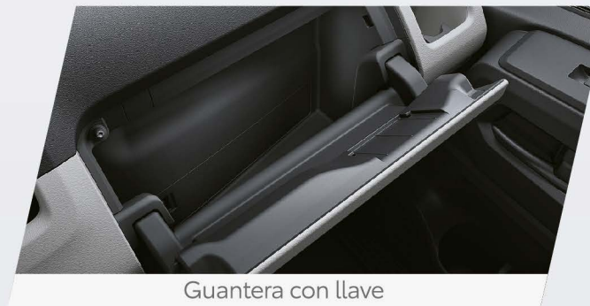
Guantera con llave