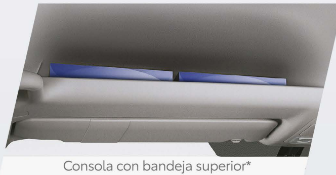
Consola con bandeja superior*