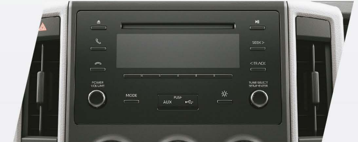
Audio con CD, MP3, USB, Bluetooth® y manos libres