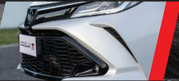
Paragolpes delantero exclusivo con detalles aerodinámicos

Su estética deportiva es el reflejo de la filosofía Gazoo, de compartir y superarnos en cada momento. Por dentro vas a encontrar el confort y la tecnología para enfrentar cualquier obstáculo que se te presente en el camino.