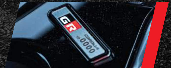
Emblema GR con serial de la unidad