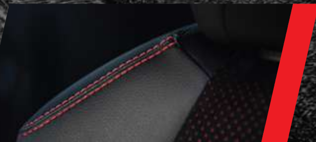
Asientos tapizados de cuero natural y ecológico combinado con Ultrasuede y costuras en rojo