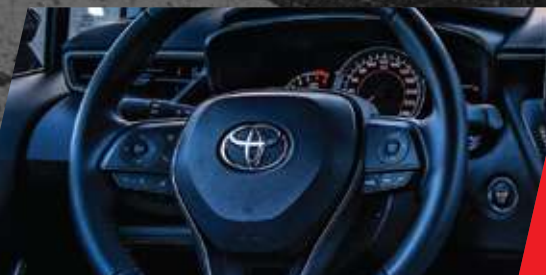
Levas al volante