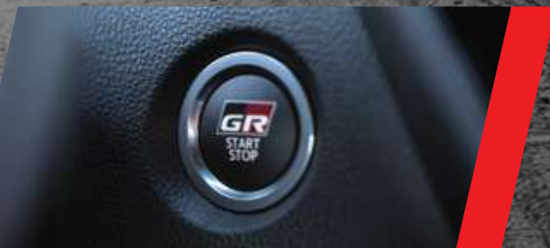
Sistema de encendido por botón con diseño Gazoo Racing