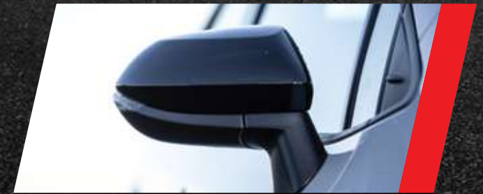
Espejos exteriores color negro