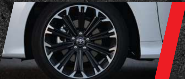
Llantas de aleación 17"