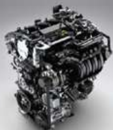
Motor 2.0 Dynamic Force

La suspensión deportiva GR varía la respuesta y la rigidez de los amortiguadores en función del estado del asfalto y el estilo de manejo, que sumado al último motor 2.0 de Corolla, ofrece un confort de marcha excepcional para poder sentir esa emoción al volante que acelera el corazón.