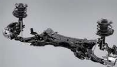
Suspensión deportiva GR