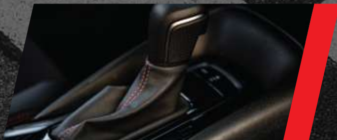
Transmisión automática "Direct Shift CVT"