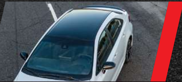
Techo color negro metalizado